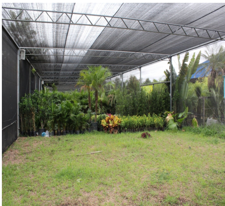
Sombrite (02) no A-8 (Plantas, arbustos/90m²) — Valor: R$ 1 mi.