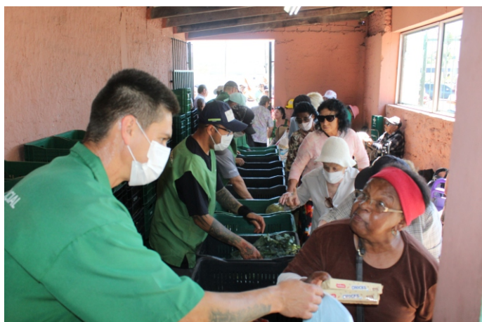
Idosas e donas de casas enchem as sacolas com hortifrúteis

O Banco de Alimentos atende semanalmente 468 famílias carentes e 150 instituições assistenciais (asilos, creches, associações comunitárias, etc.). Os hortifrúteis são doados por produtores e atacadistas. Aos permissionários, nosso eterno agradecimento.