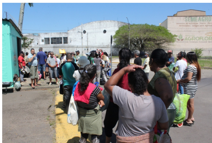
Cadastrados no programa social chegam cedo na fila