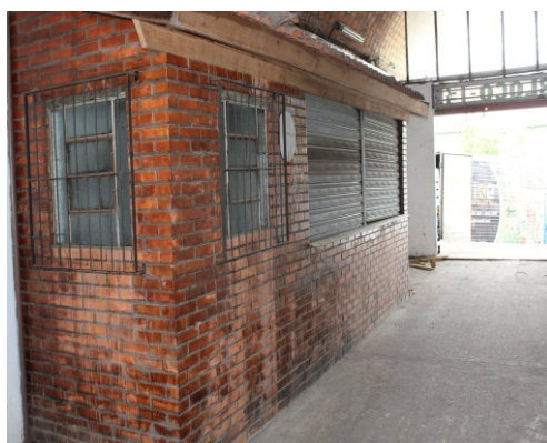
Lancheria no E-1 (9m²) — Valor: R$ 15 mil