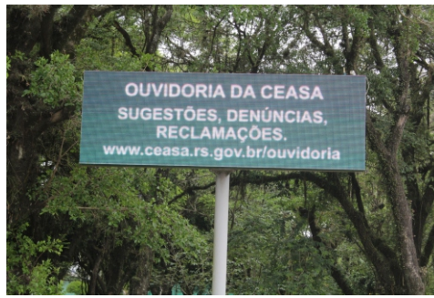
Painel eletrônico na rótula do Pórtico Norte

Placas no Pórtico Norte, acesso pela avenida Fernando Ferrari, e no Pórtico Sul, ingresso pela rua Giuseppe Mandelli, informam aos clientes que o complexo de 42 hectares é monitorado por 214 câmeras. O investimento, em parceria com os permissionários, aumentou a segurança para todos que circulam no entreposto.