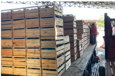
Abastecimento foi afetado parcialmente

No começo de novembro, o abastecimento de mercadorias vindas de outros estados foi afetado em virtude de protestos políticos que bloquearam várias estradas do país. Felizmente o escoamento da produção foi regularizado em pouco tempo, evitando prejuízos maiores para comerciantes e consumidores.