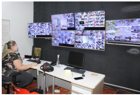
Sala de videomonitoramento na Segurança