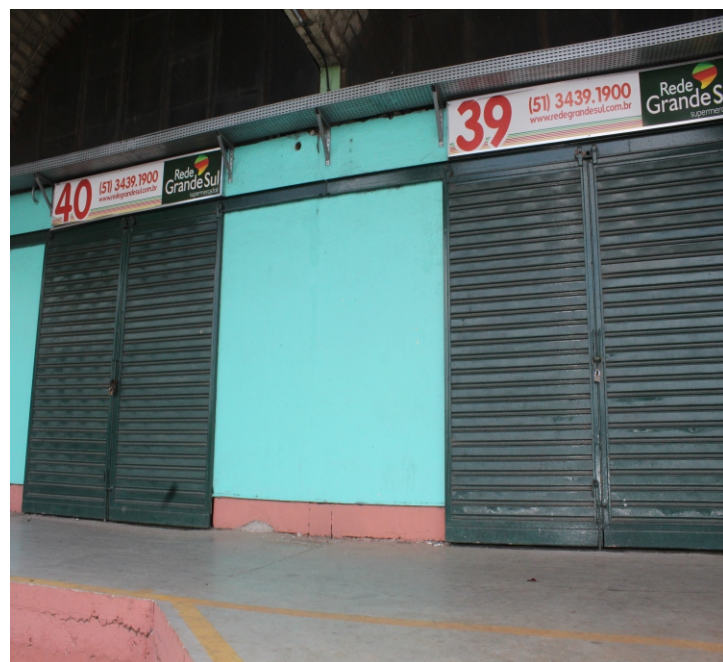
Boxes 39 e 40 no E-1 (50 m² cada) — Valor: R$ 51 mil cada.