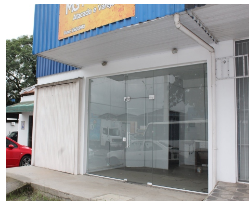
Peixaria (01) no B-2 (67 m²) — Valor: R$ 25 mil