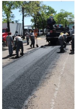
Nestas imagens, trechos revitalizados entre os pavilhões A2 e A3 e na via em frente aos setores de Limpeza e Manutenção do complexo