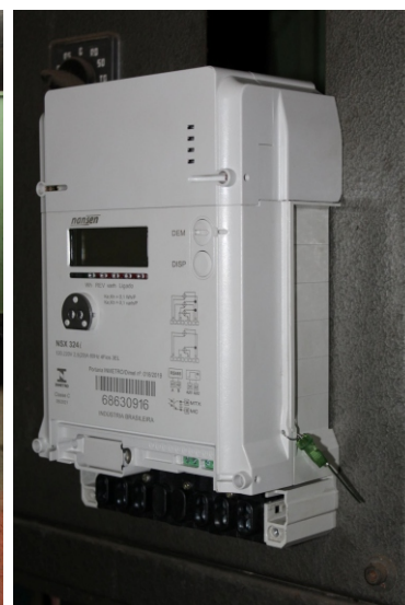
Servidores da Manutenção deram uma retocada no visual externo do prédio e instalaram dispositivos de controle nas duas subestações internas