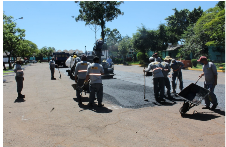
Empresa conta com vários operários na execução das tarefas que vão da varrição e limpeza da pista à aplicação de piche e de camadas de asfalto