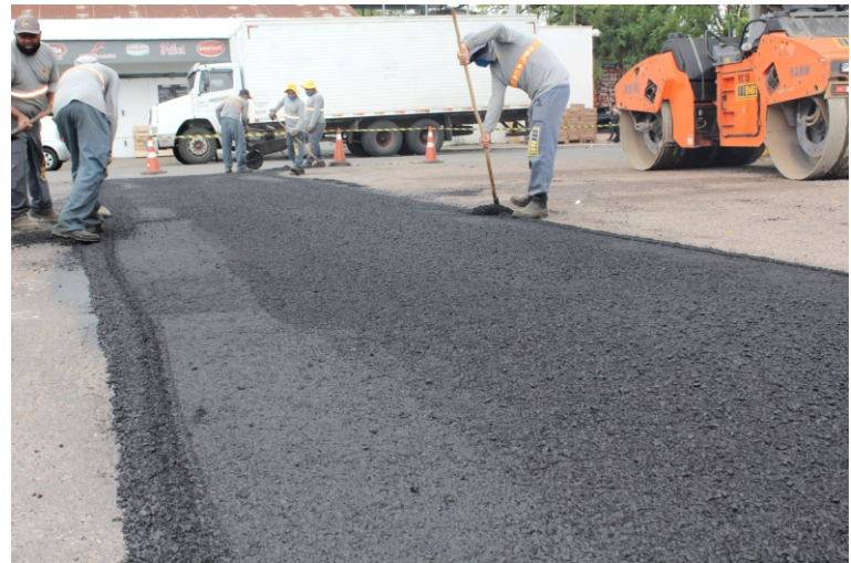
Operários trabalham às segundas, quartas e sextas-feiras cumprindo o cronograma de obras que prevê recapeamento dos trechos mais desgastados