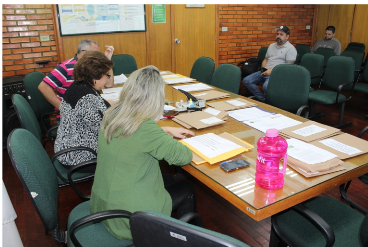
Comissão Especial de Licitação analisou as propostas apresentadas