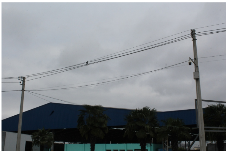
Energia mais barata, segurança e vantagem ambiental atraem consumidores

A direção recebeu informações da Electric Consultoria e Serviços S/S, empresa do mercado de energia livre, sobre a migração do mercado cativo, onde a Central se abastece via CEEE Equatorial, para o mercado livre, que apresenta um ambiente em que os participantes podem negociar preço, quantidade contratada, período de suprimento, pagamento, entre outras opções. A economia pode chegar a 28%. A migração será comunicada em agosto para a CEEE e efetivada em fevereiro de 2023.