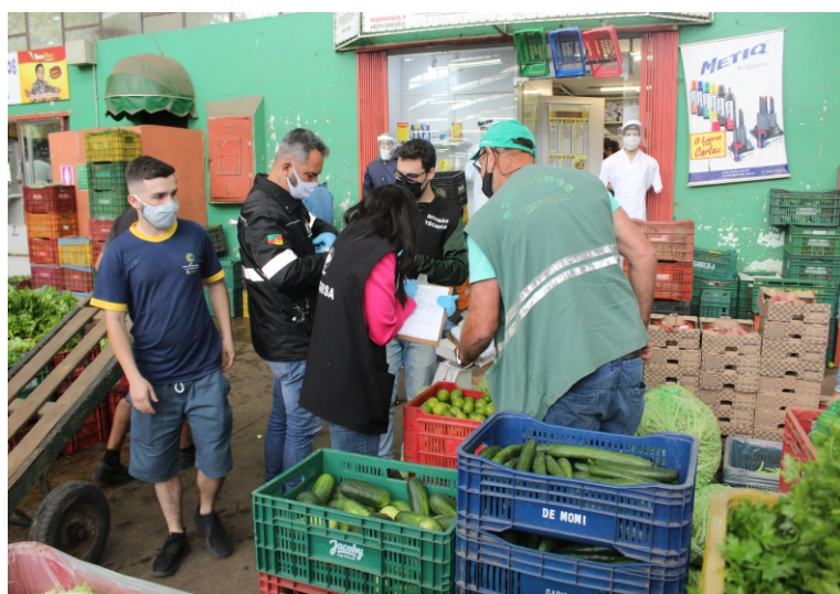
Coletas de amostras de hortifrúteis são realizadas pela Gerência Técnica

Nos últimos anos, o índice de inconformidades vem caindo e o de conformidades subindo, graças ao trabalho de orientação da cadeia produtiva feito pelos nossos técnicos, com apoio da Secretaria da Agricultura e Emater-RS/Ascar. De 2018 para 2021, o percentual de laudos satisfatórios aumentou 20%. Passou de 61% para 81%, respectivamente. A incidência de resíduos também diminuiu. Baixou de 39% em 2018 para 19% em 2021.