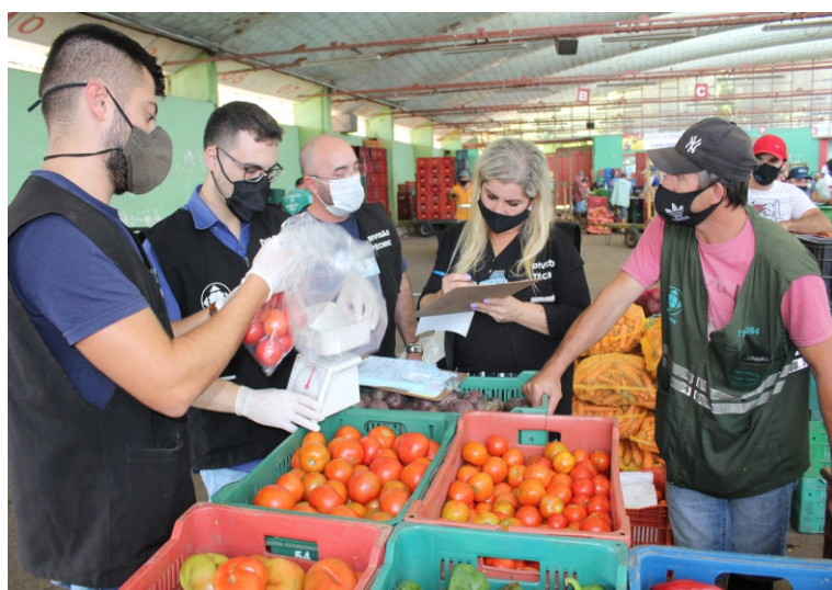
Ações do Grupo de Trabalho Alimento Seguro são referência no país