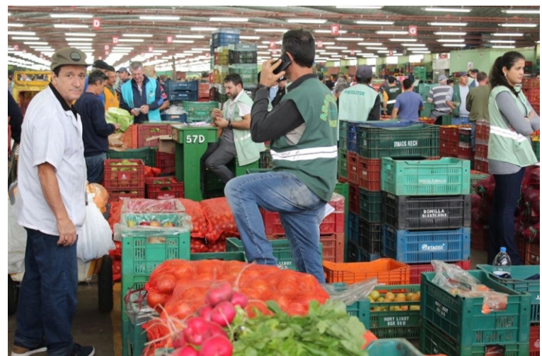
Redução também será sentida no GNP, local com 686 pontos de iluminação