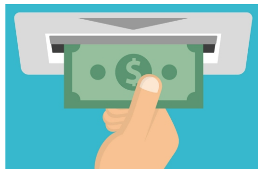
Operações podem ser realizadas 24 horas por dia

O caixa eletrônico 24 Horas, instalado pela empresa vencedora da licitação, já está funcionando no Centro de Utilidades Públicas (CUP). O equipamento está localizado na calçada entre as agências do Banco do Brasil e do Banrisul. Neste caixa, clientes do Banco do Brasil, da Caixa Econômica Federal, do Bradesco, do Itaú, do Santander, do Banrisul, e de outras instituições financeiras, podem realizar saques, consultar extratos e saldos e fazer pagamentos e transferências.