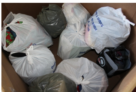
Deixe sua contribuição nas caixas de coletas

Participe da onda de solidariedade que aquece e ajuda quem precisa. Se você ainda não separou aqueles itens do vestuário, guardados e sem uso, aproveite o friozinho que anda fazendo para demonstrar amor ao próximo. Deixe sua sacola com roupas, calçados e cobertores nas caixas colocadas no GNP (ao lado da Sala de Orientação) e no prédio administrativo. Colabore!