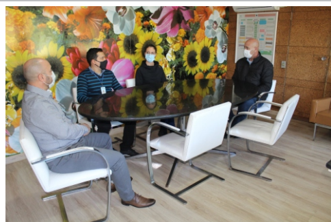
Laudos técnicos serão feitos em Caxias

As análises laboratoriais dos hortifrúteis comercializados na Ceasa serão feitas pelo Laboratório de Análises e Pesquisas em Alimentos (Lapa) da Universidade de Caxias do Sul. Em maio, representantes visitaram a Ceasa. O Lapa prestará esse serviço por intermédio do Sebrae/RS, que mantém parceria com a Ceasa no controle da qualidade dos alimentos.