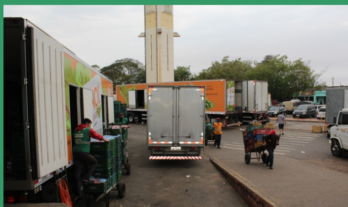
Critérios de enquadramento de irregularidades também foram alterados