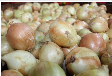
A cebola foi um dos temas da nova série