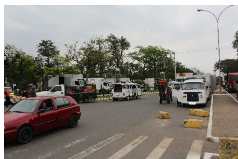
Vias de circulação não podem ser obstruídas

A direção reitera que a venda e eventual exposição de produtos na área externa devem ser realizadas com as mercadorias nas carrocerias dos veículos estacionados nas plataformas ou nas ruas laterais ao GNP. É proibida a venda de hortifrúteis em carrinhos, distantes do veículo, sob lonas ou barracas que ocupem canteiros e vias de circulação.