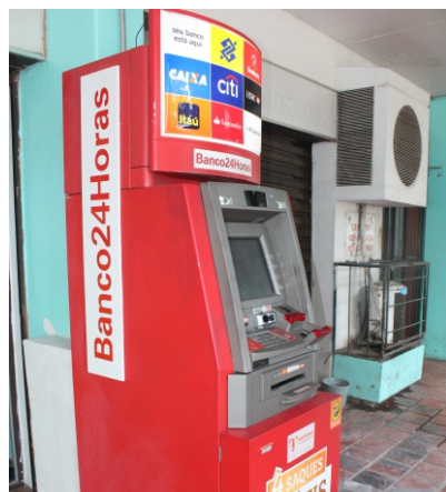
Serviços bancários na área externa

O caixa eletrônico 24 Horas, instalado pela empresa vencedora da licitação, já está funcionando no Centro de Utilidades Públicas (CUP). O equipamento está localizado na calçada entre as agências do Banco do Brasil e do Banrisul. Neste caixa, clientes do Banco do Brasil, da Caixa Econômica Federal, do Bradesco, do Itaú, do Santander, do Banrisul, e de outras instituições financeiras, podem realizar saques, consultar extratos e saldos e fazer pagamentos e transferências.