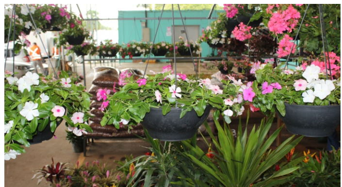
Variedade de flores, folhagens e acessórios para atender a clientela

Nas semanas que antecedem as chamadas “datas especiais” para este setor, como Dia Internacional da Mulher, Dia das Mães e Dia dos Namorados, lojistas da Central de Flores registram aumento nas vendas. Foi o que ocorreu nesse mês de maio que agora se encerra. Nos dias anteriores ao domingo dedicado às Mães, houve acréscimo considerável na comercialização de flores, folhagens e acessórios. Em alguns casos como o da São Paulo Sul Flores as vendas cresceram até 100%, comparadas as do mesmo período do mês anterior. Lojas como a Encanto das Flores e a Garden Green Vasos usaram estratégia que nunca falha nessas ocasiões: a primeira sorteou um box com presentes e a segunda concedeu desconto no preço de vasos. E vem aí o Dia dos Namorados. Preparem-se!