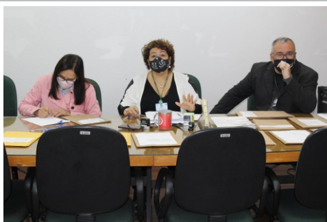
Empresas adquiriram 19 espaços comerciais

A disputa por boxes e pontos estratégicos realizada no dia 17 de maio proporcionou arrecadação de R$ 469,4 mil. A licitação foi feita em duas etapas para separar os setores de interesse e em virtude da pandemia para assegurar distanciamento entre as pessoas no auditório. De acordo com a Comissão de Licitação, 15 empresas adquiriram 19 espaços comerciais.