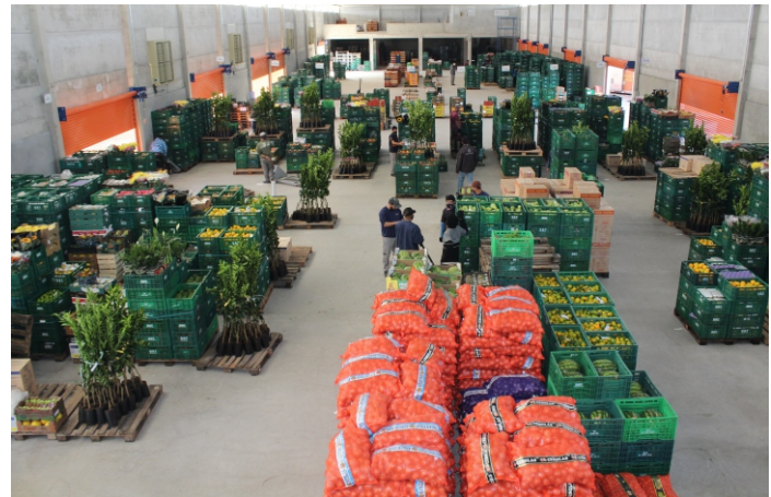
Prédio tem mezaninos com escritórios, sanitários e refeitório

Além de ser estratégica para a empresa, a nova sede será fundamental para a atividade comercial desenvolvida na Ceasa, representando um grande diferencial competitivo num mercado que contempla várias etapas, entre elas a movimentação e a entrega de produtos.