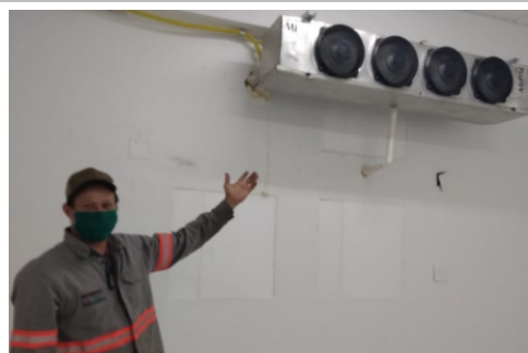
Temperatura chega a cinco graus positivos