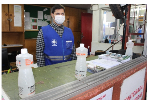
Dispensadores de álcool em gel 70% no GNP

A Ceasa disponibiliza em três pontos do complexo totens com dispensadores de álcool em gel 70%. Os totens estão na recepção do prédio administrativo, no setor de Manutenção e no Banco de Alimentos. Além desses equipamentos, há pontos para higiene das mãos na entrada de pedestres, no Pórtico Norte, nos sanitários, e recipientes com álcool em gel no GNP.