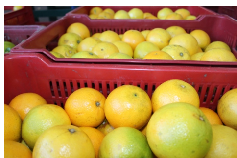
Laranjas, bergamotas e limões suculentos

A reunião da Câmara Setorial da Citricultura nos estimulou a visitar o Pavilhão dos Produtores para conferir a qualidade da safra de laranjas e bergamotas produzidas aqui no Estado. Segundo os agricultores, as frutas estão lindas, doces e suculentas. Os limões estão ótimos também. Os preços destes e de outros hortifrúteis podem ser consultados no site ( www.ceasa.rs.gov.br ).