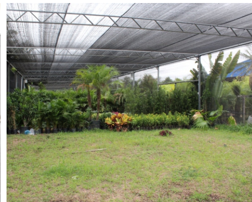
Lancheira, no Pavilhão E1, e área no Sombrite, destinada à comercialização de folhagens e arbustos