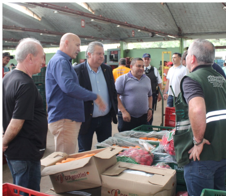
No GNP, conversou com produtores e viu a qualidade dos hortifrúteis