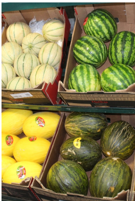
Setorização facilita escolha do cliente

Em algumas empresas, a estratégia de venda baseada na exposição de produtos organizados, limpos e com visual atraente, vem seguida de uma ação complementar e infalível: a degustação. O paladar do cliente também precisa ser testado para coroar a sensação descrita no começo desse texto. No Pavilhão E2, por exemplo, a Donato Melancias (Boxes 4, 5 e 6) oferece pedaços de frutas para o consumidor experimentar. Perto dali, no Galpão 4, produtores de melancias da Região Metropolitana também convidam os clientes para provar fatias das variedades expostas, oferecendo a mesma experiência para o consumidor. As fotos desta matéria especial foram feitas na Bella Fruta (Box 2 no D2), Tchê Frutas (Box 21 no D3), Silvestrin (Boxes 13 a 17 no D3) e Portal das Frutas (Boxes 5 a 7 no D3).