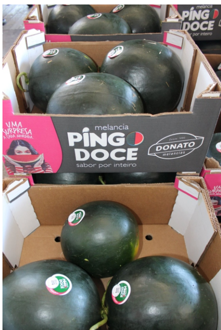
Caixas personalizadas fortalecem a marca

Se a propaganda é a alma do negócio, o cuidado com a apresentação dos produtos deve ser prioridade máxima de comerciantes que desejam aumentar as vendas