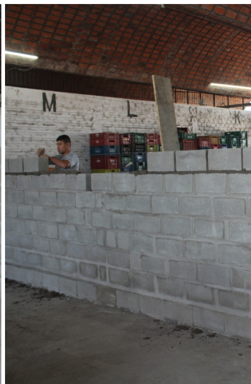
Servidores da equipe de Manutenção trabalham para finalizar a construção das paredes de quatro boxes dentro do amplo espaço