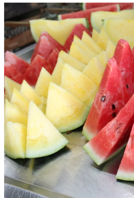
Degustação é outra parte da estratégia

Em algumas empresas, a estratégia de venda baseada na exposição de produtos organizados, limpos e com visual atraente, vem seguida de uma ação complementar e infalível: a degustação. O paladar do cliente também precisa ser testado para coroar a sensação descrita no começo desse texto. No Pavilhão E2, por exemplo, a Donato Melancias (Boxes 4, 5 e 6) oferece pedaços de frutas para o consumidor experimentar. Perto dali, no Galpão 4, produtores de melancias da Região Metropolitana também convidam os clientes para provar fatias das variedades expostas, oferecendo a mesma experiência para o consumidor. As fotos desta matéria especial foram feitas na Bella Fruta (Box 2 no D2), Tchê Frutas (Box 21 no D3), Silvestrin (Boxes 13 a 17 no D3) e Portal das Frutas (Boxes 5 a 7 no D3).