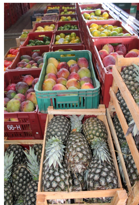
Alinhamento e padronização nos boxes

Cada detalhe na montagem de estandes e gôndolas para exposição de frutas, legumes, verduras e flores atrai e agrada os consumidores. Em muitos casos, investir na apresentação dos produtos pode ser decisivo para o aumento das vendas. Na Ceasa, a expressão popular “comer com os olhos” ocorre a todos que circulam pelos boxes das empresas atacadistas de frutas, principalmente pelo visual colorido, e no Pavilhão dos Produtores, de modo especial no canto destinado às banquinhas da área de varejo. Nesses espaços os permissionários expõem as melhores frutas e legumes de forma a despertar nos clientes esse tipo de sensação e desejo.