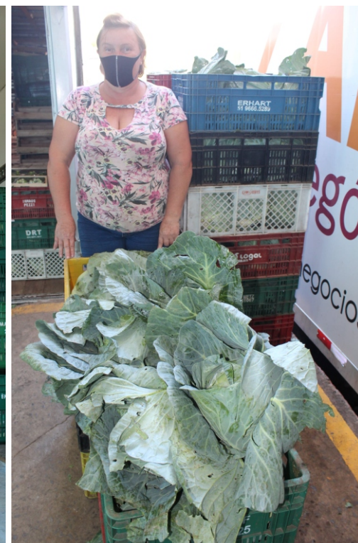
Onda de calor afetou a produção, a qualidade e a aparência dos hortifrúteis, e ainda causou aumento de preços para o consumidor