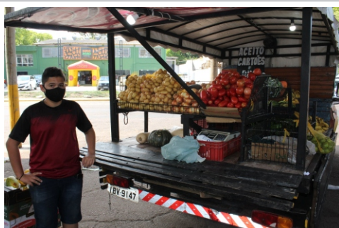
Feiras ambulantes sobre quatro rodas

Carrocerias de pequenos caminhões como esta são adaptadas para transporte e venda de hortifrúteis. Sob o comando dos comerciantes, esses veículos transformam-se em feiras ambulantes sobre quatro rodas. Nos expositores improvisados, a família desse vendedor de Gravataí acomoda frutas, verduras e legumes, além de contar com iluminação.