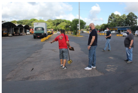
Segunda etapa prevê mais R$ 178 mil

Diretores visitaram pontos que serão contemplados na segunda fase da operação tapa-buracos. Na primeira foram recuperados 90 trechos desgastados numa área de 10.687 m 2 . O investimento, em parceria com os permissionários, foi de R$ 715,3 mil. O aditamento de 25% no contrato, em estudo pela direção, prevê cobertura asfáltica para uma área de 2.488 m 2 , totalizando R$ 178 mil em investimento.