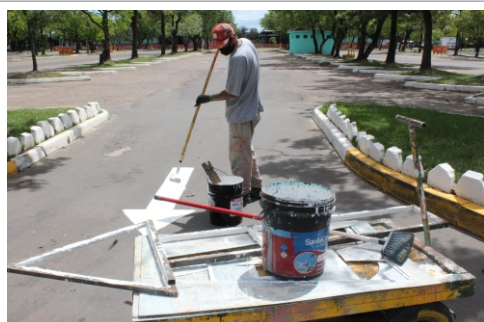
Emergências e serviços de rotina

Equipes de Manutenção estão preparadas para qualquer imprevisto. Um serviço programado para ser realizado em determinada data pode ser substituído por outro em virtude de uma emergência. Quando isto acontece, servidores são deslocados imediatamente para fazer consertos, pequenos reparos e até sinalização viária como mostra a foto.