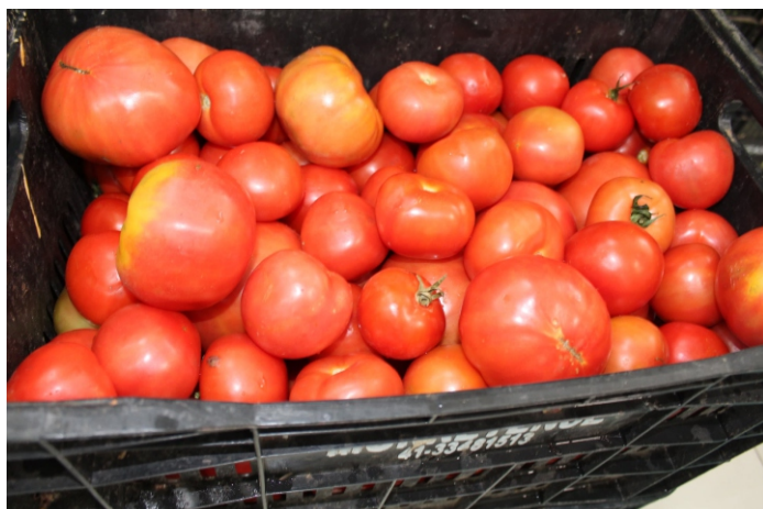
Hortifrutigranjeiros e itens da cesta básica foram doados

A Abracen disponibilizou R$ 10 mil para cada Ceasa adquirir cestas básicas que serão doadas com os alimentos arrecadados na campanha. Aqui na Ceasa colocamos quatro pontos de coleta de alimentos não perecíveis (feijão, arroz, óleo, açúcar, farinha, café, etc.). Nos dias 28 e 29, arrecadamos frutas, legumes e verduras com os permissionários. No dia 30 de abril, as doações serão distribuídas na região das ilhas e em vilas no entorno da Ceasa.