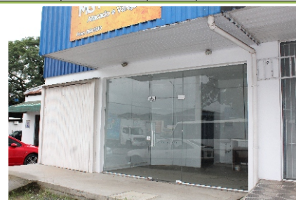
Salas no CUP e peixarias no setor B2 (D) são pontos que estarão à venda nesta edição