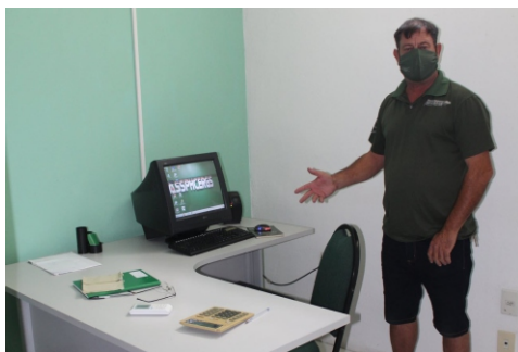
Atendimento é realizado nas associações