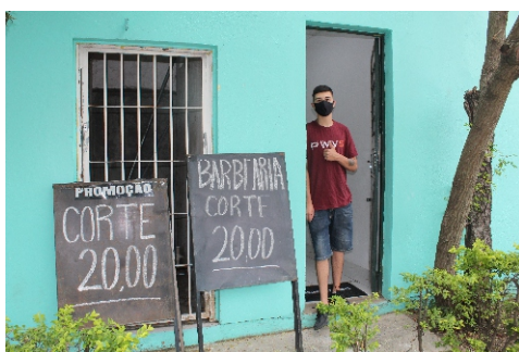
Serviço oferecerá desconto para associados

A barbearia localizada na área externa do Centro de Utilidades Públicas foi reaberta. Funcionará nas segundas, das 6h às 12h; terças, quintas e sextas, das 8h às 19h; e quartas, das 8h às 17h, respeitando os protocolos sanitários e a cor das bandeiras. O corte masculino custa R$ 20. Para fazer a barba também é cobrado o mesmo valor, R$ 20.