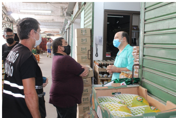
Diretor (C) e orientador visitaram boxes das empresas atacadistas

Depois de anunciar medidas como advertência e aplicação de multa para quem estiver sem máscara ou usando a proteção facial de forma incorreta, a direção emitiu circular exigindo comunicação imediata de casos positivos. A fiscalização redobrada justifica-se em virtude do momento de extrema gravidade da pandemia, com aumento do número de contaminados e falta de leitos hospitalares, fatores que estão causando colapso no sistema de saúde. Diretores e orientadores estão circulando pelo complexo para reiterar a importância do respeito às medidas. Lembre-se: a máscara deve cobrir a boca e o nariz. Sempre!