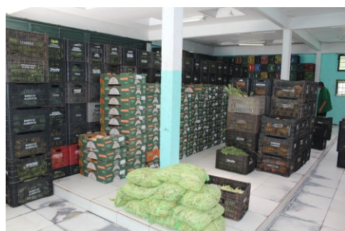
Kit de doações terá pescados a partir de abril

Instituições assistenciais e famílias carentes atendidas pelo Banco de Alimentos da Ceasa passarão a receber peixes e frutos do mar sempre que houver apreensão de pescados pelo Ibama. O incremento no kit de frutas, legumes e verduras distribuído semanalmente é fruto de parceria com o programa Mesa Brasil do Sesc/RS.