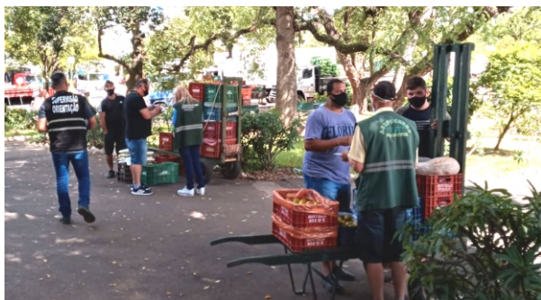
Equipe alerta carregadores para o uso correto da máscara