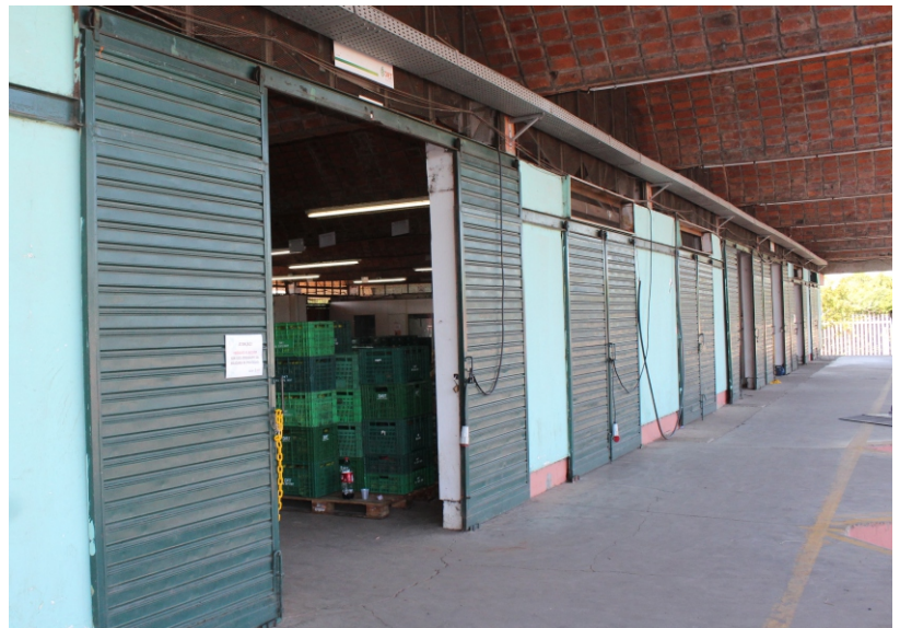
Boxes para logística no E2 (acima), para serviços no Centro de Utilidade Pública (à esquerda) e Sombrite (abaixo) são alguns dos espaços que irão à venda