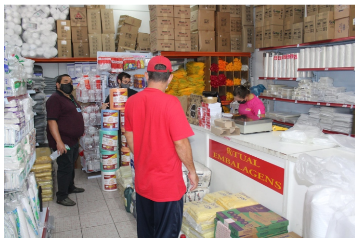
Trabalho de conscientização é feito com clientes também