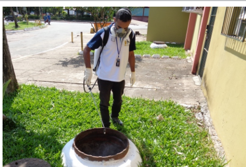
Imunizadora atua na prevenção e combate

Mensagem de áudio reproduzida na área interna da Ceasa informa os usuários sobre ações preventivas contra escorpiões-americanos. Se você encontrar algum escorpião, ligue para: 2111-6618 (Limpeza); 2111-6614 (Supervisão Operacional); ou para 2111-6634 (Vigilância).