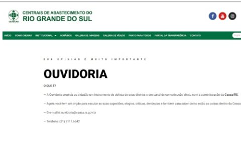
Respostas em até cinco dias

A Ceasa, seguindo o que determina a Lei da Transparência (LC 131/2009), criou um portal contendo informações que permitem à sociedade acompanhar o uso de recursos e atos administrativos. Temas como Licitações e Portarias estão à disposição para serem consultados pela internet. Acesse o Portal da Transparência em ( www.ceasa.rs.gov.br ).