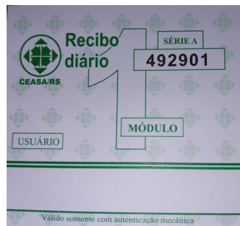
Mudança afeta somente produtores diaristas

O valor do tíquete diário estava defasado havia dez anos. O INPC — índice aplicado no reajuste anual desta taxa — não acompanhou o aumento de despesas como luz, água, vigilância e limpeza, neste período. É importante explicar também que os R$ 17 de diferença (o tíquete passou de R$ 53 para R$ 70) não ficarão para a Ceasa. Esse valor será usado para corrigir e reduzir o custo do rateio para produtores mensalistas que possuem módulos fixos. Cabe ao produtor diarista avaliar e optar se é mais vantajoso continuar pagando os tíquetes diários ou se tornar mensalista. O reequilíbrio financeiro foi aprovado pela Contadoria e Auditoria-Geral do Estado (Cage) e pelo Conselho de Administração da Ceasa.