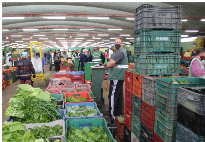
Agricultores terão tomadas para conectar celulares e notebooks

Depois de 46 anos, a reforma da rede de energia do Pavilhão dos Produtores (GNP) se impõe em virtude da saturação de equipamentos, componentes e materiais. A licitação para escolha da empresa que fará o serviço foi aprovada pelo Conselho de Administração. Construído e inaugurado no começo da década de 1970, o prédio chama a atenção por vários motivos: extensão, beleza, solidez e funcionalidade. É um exemplo de arquitetura moderna que se destaca pelo cuidadoso planejamento do espaço e, principalmente, pela qualidade estética de suas estruturas de telhado, feitas em abóbadas (cobertura curva) e outras técnicas similares.