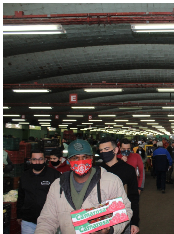
Rede de energia também será readequada