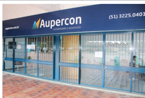
Assessoria e controle de despesas

Quem circula pelo B1 já notou. Além da nova agência da Coopesa (Cooperativa de Economia e Crédito Mútuo), este setor também conta com os serviços da Aupercon — Contabilidade e Assessoria. As duas empresas estão instaladas em salas novas e bem iluminadas.