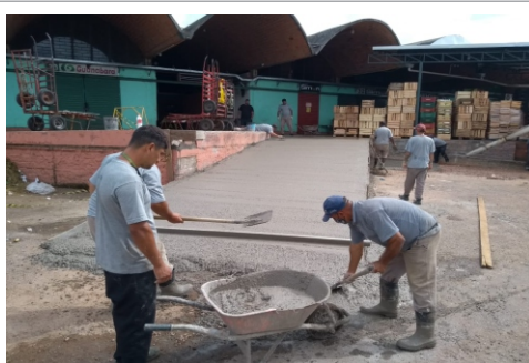
Reposicionamento das rampas

A equipe de Manutenção não para. As obras de melhorias na drenagem junto à Central de Flores (A8) resolverão problema crônico de alagamento. E a reforma da plataforma no A4 facilitará a manobra e o deslocamento de veículos neste setor do complexo.