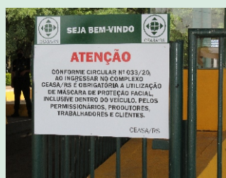
Uso de máscara é obrigatório

A administração instalou placas de orientação sobre o fluxo de veículos na avenida Fernando Ferrari, em frente à entrada principal da Ceasa, no Pórtico Norte, e placas de alerta para a obrigatoriedade do uso de máscaras (proteção facial) na área interna do complexo, inclusive dentro dos veículos que ingressam no maior entreposto de hortifrutigranjeiros do Estado.