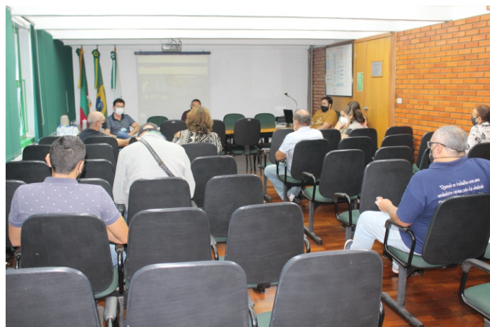
Reunião serviu para esclarecer dúvidas e alinhar ações

O trabalho eficaz de prevenção e controle realizado pela Ceasa, e elogiado pela Vigilância Sanitária, tem reduzido a presença do escorpião-amarelo. A Imunizadora Renck é especializada na prestação de serviços de controle sanitário integrado no combate a pragas (vetores), especificamente na desinfestação de roedores, escorpiões, mosquitos e insetos voadores e rasteiros, tais como baratas, cupins, formigas, pulgas, e traças.