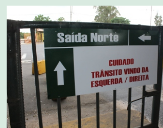
Preste atenção no trânsito

A administração instalou placas de orientação sobre o fluxo de veículos na avenida Fernando Ferrari, em frente à entrada principal da Ceasa, no Pórtico Norte, e placas de alerta para a obrigatoriedade do uso de máscaras (proteção facial) na área interna do complexo, inclusive dentro dos veículos que ingressam no maior entreposto de hortifrutigranjeiros do Estado.