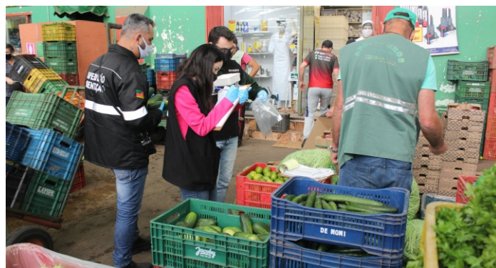
Alimentos coletados por servidores são enviados para laboratório

Em 2020, serão analisadas 100 amostras dos mais diversos produtos (O Sebrae-RS financia 70% e os 30% restantes são pagos pelos produtores do GNP). Outras 40 amostras dependem de processo licitatório. O custo, neste caso, é dividido entre a Ceasa (50%) e os atacadistas (50%).