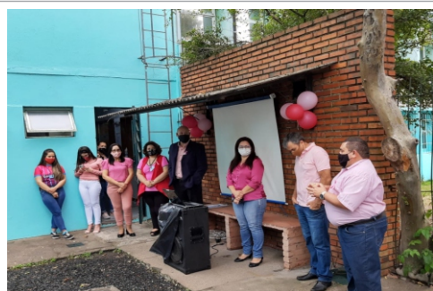
Evento em homenagem ao Outubro Rosa

Palestra sobre câncer de mama e eleição da nova gestão