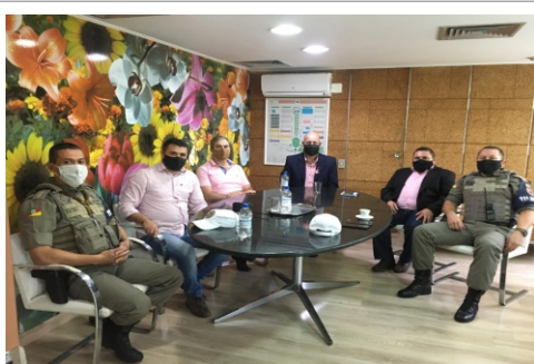
Visita de oficiais da Brigada Militar