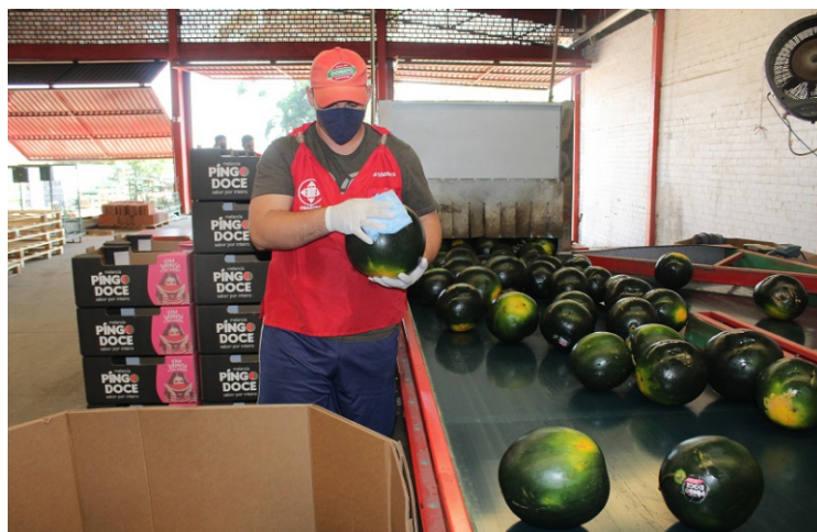
Higienização de potes plásticos de alho triturado e lavagem de melancias são procedimentos de rotina nos boxes das empresas atacadistas