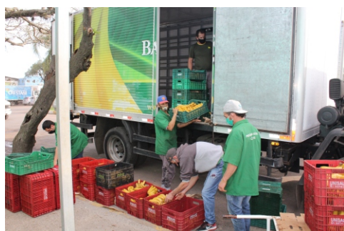
Doações aumentaram em agosto

A mão solidária dos permissionários continua sendo estendida para o Banco de Alimentos. Em agosto, o programa social recebeu 82,5 toneladas de hortifrúti, maior volume de 2020 e quase o dobro do volume destinado no mesmo mês do ano passado.