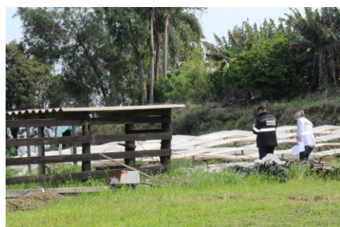
Orientadores conferem a realidade local

Servidores deslocam-se até as pequenas propriedades de agricultores que comercializam sua produção na Ceasa. Além de verificar a realidade da produção local, os orientadores aproveitam para cotejar informações registradas na Declaração de Produção e Intenção de Cultivo.