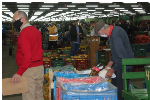
Novas regras exigem EPI, distanciamento seguro e afastamento de casos suspeitos

Máscaras e protetores faciais são itens de prevenção