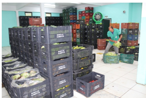
Redução do volume de doações preocupa coordenadora do programa social Prato Para Todos