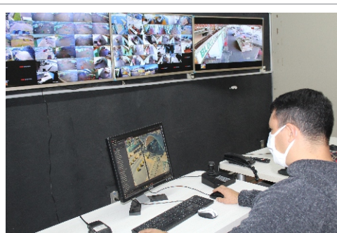
Imagens são reproduzidas em quatro telas

Em cada ponto da Ceasa, há um olho eletrônico vigiando todo e qualquer movimento. A sala de videomonitoramento recebe imagens em tempo real de 115 câmeras espalhadas no complexo de 420 mil metros quadrados. Outras 20 câmeras serão instaladas.