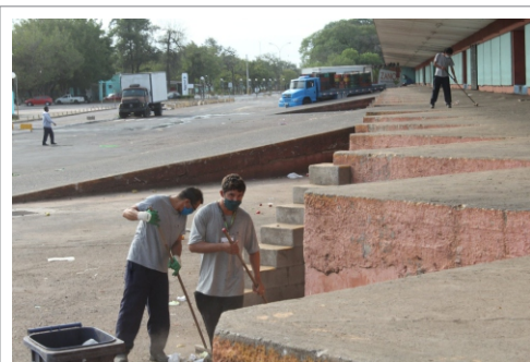
Servidores em ação no entorno do GNP

No inverno, a Ceasa recolhe de 20 a 30 toneladas de lixo em média por dia. No verão, a quantidade dobra. E, mesmo com essa montanha de resíduos, a limpeza de uma área equivalente ao tamanho de 60 campos de futebol chama a atenção pela eficiência e rapidez.