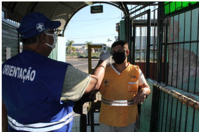
Dispositivo portátil é utilizado nos pórticos de entrada e saída

A Ceasa também dispõe de um ambulatório para primeiros socorros e casos de emergência. Durante a pandemia, a unidade de saúde da Ecco Salva está habilitada para examinar e orientar pessoas que porventura apresentem sintomas da covid-19 (tosse, febre, coriza, dor de garganta e dificuldade para respirar).